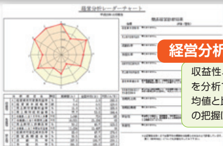
経営分析レーダーチャート

収益力や安全性の評価、目標利益の設定と目標達成のための改善策を検討でき、販売価格、費用(固定費、変動費)等の検討に役立ちます。