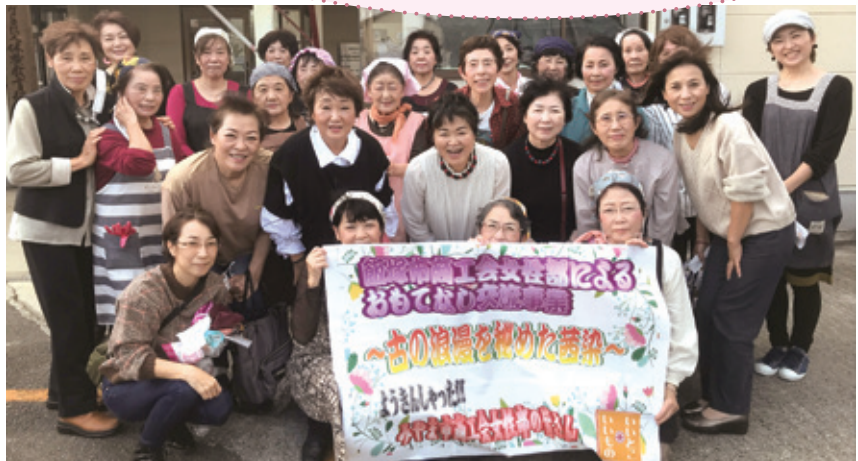
飯塚市商工会女性部とみやま市商工会女性部のおもてなし交流事業