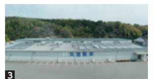
1 ロングランヒットの商品。博多座には高級和菓子ブランド「菓匠むらり」を出店している。 2 揚げ菓子ラインは機械を一新した。3 工場屋根には太陽光パネルを設置。「エコアクション21」の認証を取得し、環境活動にも取り組んでいる。

筑豊製菓株式会社 本社営業部長 村里航 飯塚市津島408-1 Tel : 0948-22-7349