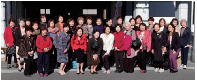
「みやぎの感謝のおもてなし 想いとともに前へ」をスローガンに掲げ、飛躍を誓った全国大会