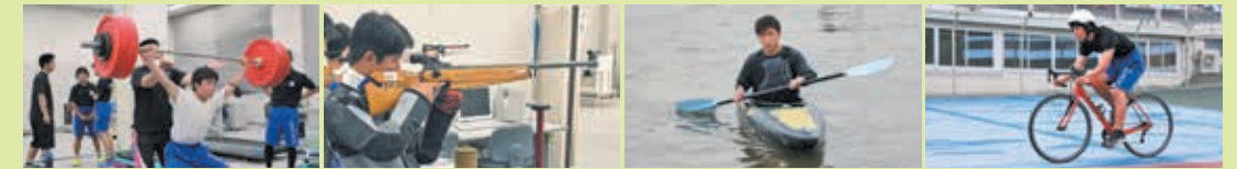
ウェイトリフティング ライフル射撃 カヌー 自転車競技

●トライアウト (中学校3年生) 高校から実施する候補競技を各競技団体の方に直接指導してもらうことにより評価をいただきます。