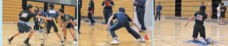
捕捉ゲーム 四方向ステップ テニスボール投げ