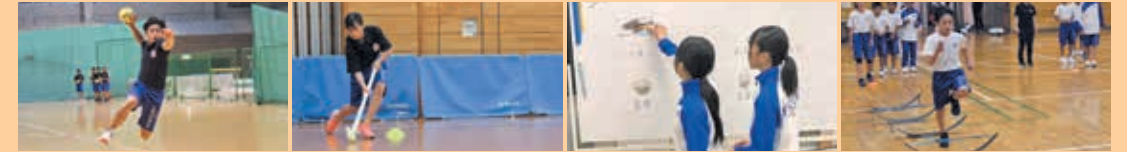
ハンドボール ホッケー 知的(食育) SAQトレーニング

●身体・知的プログラム【毎週土曜日18時~20時に行います】 年間を通して1週間に1度さまざまなプログラムを通してトップアスリートに必要な能力や知識・態度を身に付けます。 (令和5年度は、小学生11種目、中学生11種目を実施しました。)