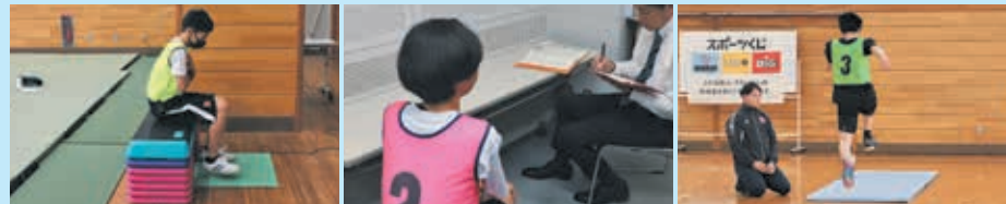
ステップング ヒアリング 五段とび