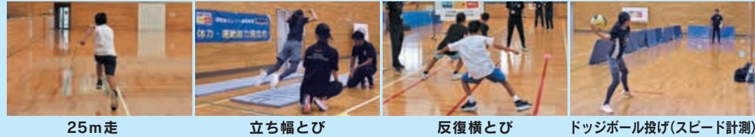
25m走 立ち幅とび 反復横とび ドッジボール投げ(スピード計測)