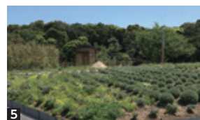
1 新展開の起点となる研修センター。2 魅力的な体験施設の数々。3 『福岡県ワンヘルス』認証を受けた新商品。4 芦屋町名産の赤紫蘇。5 園内のハーブ園。

美容薬理株式会社 代表取締役社長 金井誠一 福岡県遠賀郡 芦屋町大字山鹿814-1 Tel : 093-221-5500