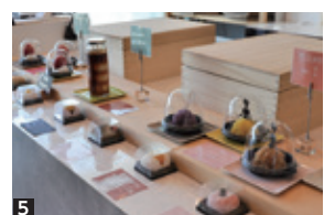
1 3 思わず写真に収めたい美しさ。2 うきは産フルーツなど地元の素材をふんだんに使って。4 もち米100%の食べ応え。5 目移りがする創作和菓子。

石橋餅加工所／暴食の果実 代表 石橋雅彦 うきは市吉井町新治 212-5 Tel : 0943-75-2694