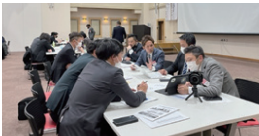
活発な意見が飛び交ったビジネス交流会